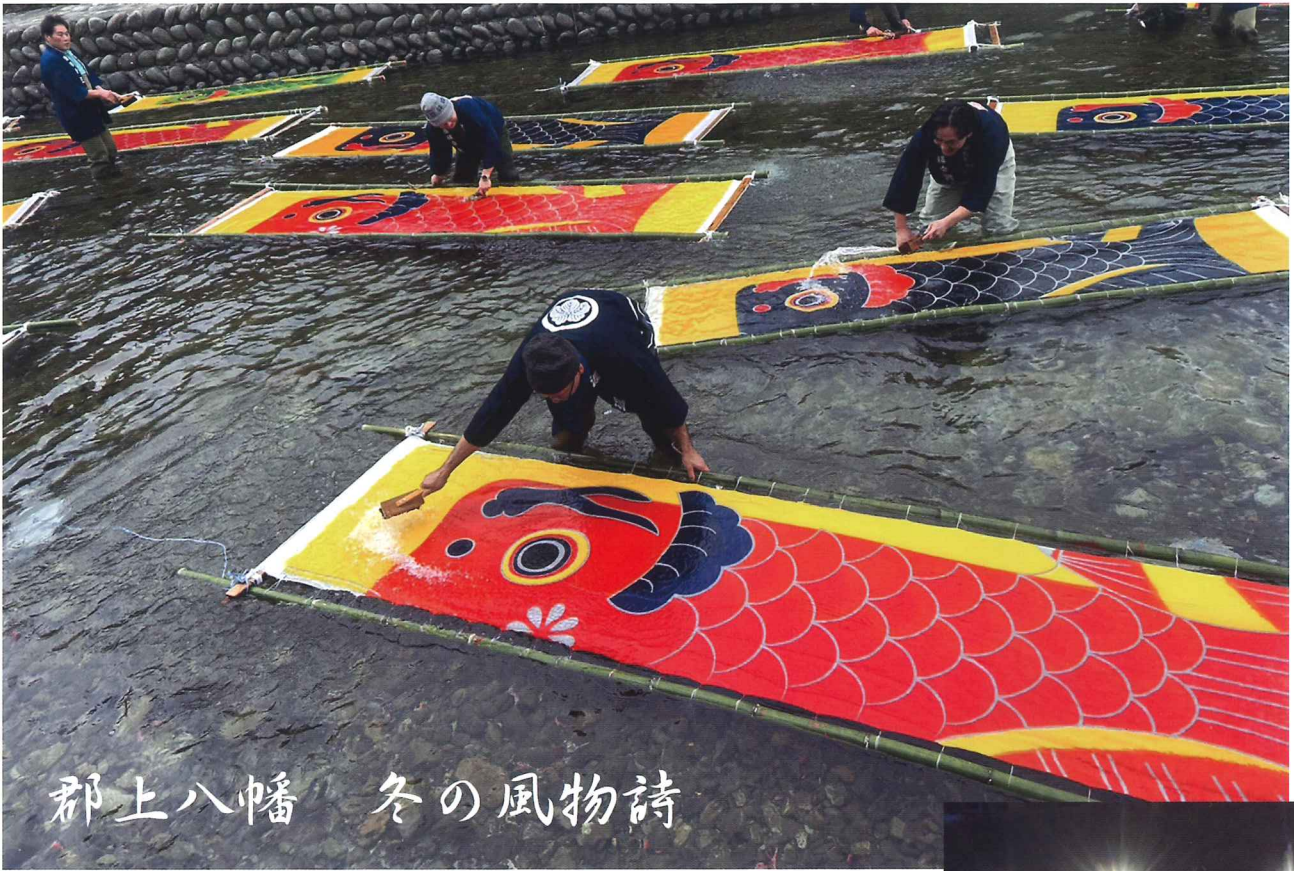
郡上八幡 冬の風物詩